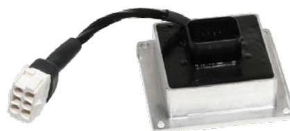
ORION DC 10

ORION DC 10是一款经济性的控制器，保护级别IP 66，可直接安装在发动机上无需安装板，适用于小型内燃式发动机。