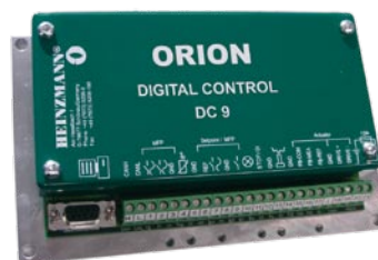
ORION DC 9

ORION DC 9是一款性价比很高的调速器，具有高度的灵活性和良好的速度控制功能，适用于小型和中型的内燃式发动机。