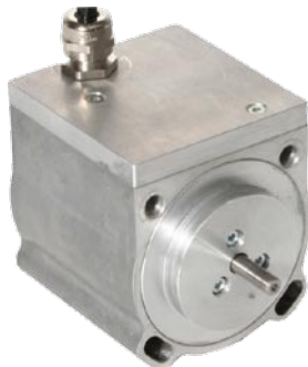
ORION StG 3005

StG 3005是直接安装型设计，可应用于众多领域，比如驱动蝶阀，油泵供杆，等等。