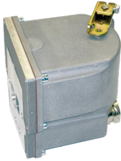
StG 2040 DP

StG 2040的DP版本是为直接安装在直列喷油泵上设计的，由数字式控制器控制。