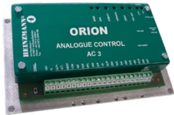
ORION AC 3

ORION AC 3是一款为功率在100 kW以内的小型柴油机的简单应用设计的控制器。该控制器可与旋转型或直线型执行器配套使用。比如用于发电机和泵驱动器。