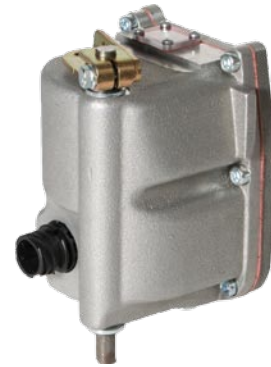
StG 2005 DP

StG 2005的DP版本是为直接安装在直列喷油泵上设计的，由数字式控制器控制。