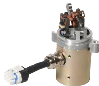
ORION LA 30

无接触反馈即使是在充满机油的环境下也可以提供高精度全程位置反馈。安装在泵的前部，需要一个安装板。