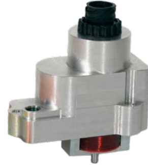
ORION StG 4002